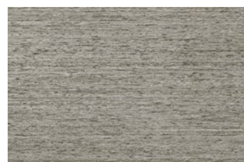
STAMPA GRIS 30x45 NAT [ ... 0,90 cm ] P63