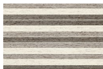
STAMPA MIX GRIS (*) 30x45 NAT [ ... 0,90 cm ] P69