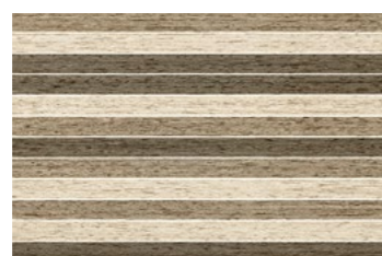
STAMPA MIX BEGE (*) 30x45 NAT [ ... 0,90 cm ] P69