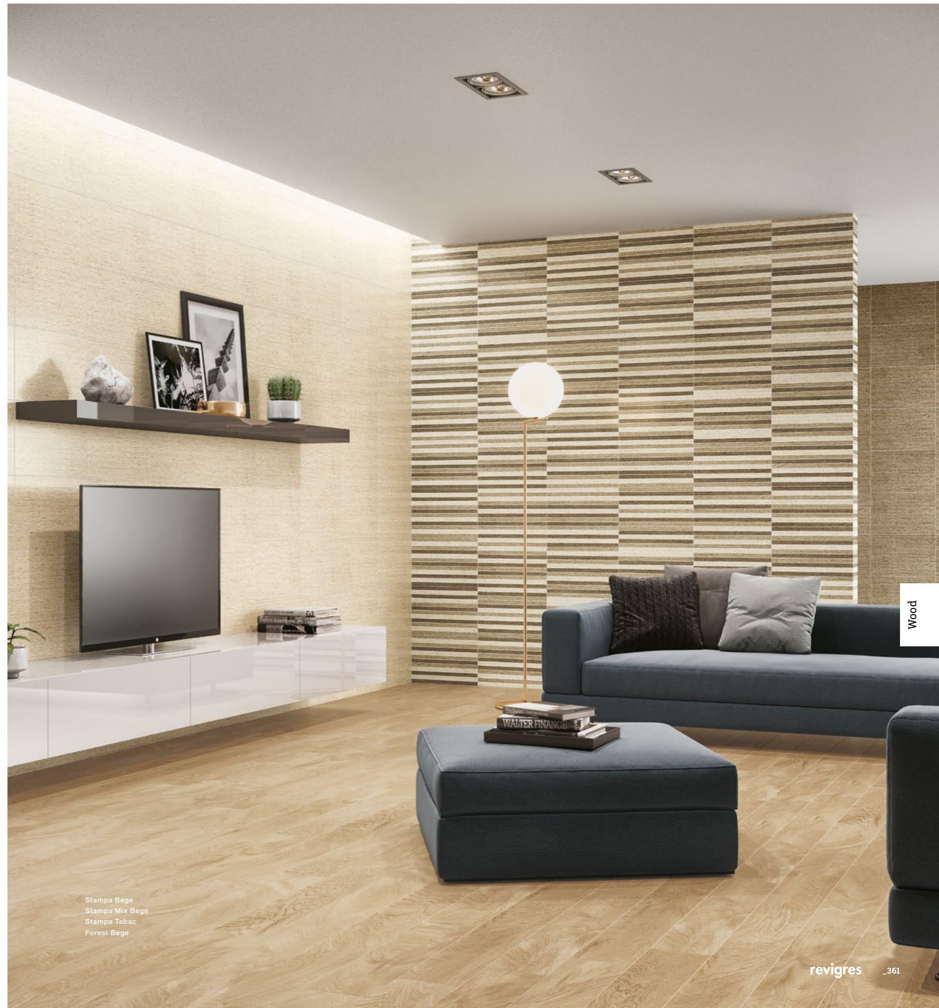
Stampa Bege Stampa Mix Bege Stampa Tabac Forest Bege