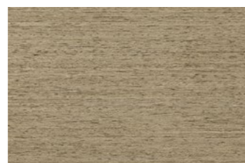
STAMPA TABAC 30x45 NAT [ ... 0,90 cm ] P63