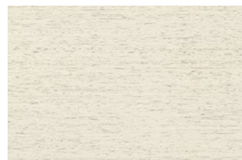
STAMPA OFFWHITE 30x45 NAT [ ... 0,90 cm ] P63